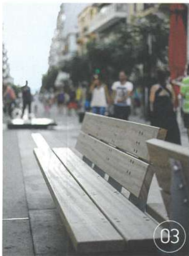
03 Από τον πεζόδρομο δεν θα μπορούσαν να απουσιάζουν τα καθιστικά, για να ξεποσαίνουν οι περαστικοί: δεν υπάρχει καλύτερο σημείο, για να αποηύσετε την περαντζάδα στον δρόμο ή τον καφέ που πήρατε από κάποιον από τα παρακείμενα καταστήματα.