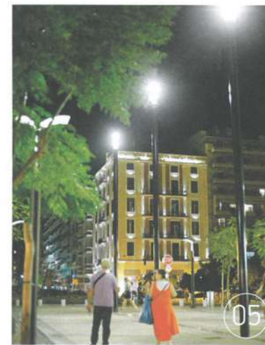
05 Τα φωτιστικά βρίσκονται εκατέρωθεν της κεντρικής περιοχής. Ακριβώς στο μέσον, στο ύψος της Μακένζι Κινγκ, τοποθετήθηκαν τρεις φωτιστικοί στύλοι, σηματοδοτώντας την αρχή του. Αντίστοιχοι στύλοι βρίσκονται στο τέλος του, στο ύψος της Τσιμισκή.