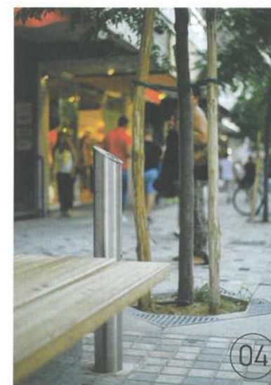
04 Πέραν των κάδων απορριμμάτων σε διάφορα σημεία, δίπλα σε κάθε καθιστικό υπάρχει ειδικός κάδος για τους καπνιστές. Οι θεριακλήδες μπορούν να σβήσουν εκεί τα τσιγάρα τους (μέχρι να πάρουν την απόφαση να κόψουν το κάπνισμα...).