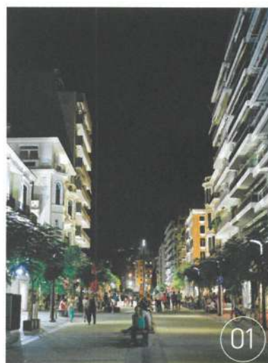
01 Ένας αρμός - «ποταμός» διατρέχει αξονικά τον δρόμο και ορίζει δύο περιοχές: τη δυτική ως ζώνη αποκλειστικής χρήσης πεζών και την ανατολική, με ζώνη ποδηλατόδρομου και δυνατότητα διέλευσης οχημάτων εξυπηρέτησης.

Το τμήμα του άξονα που έχει ολοκληρωθεί έχει χαρακτήρα εμπορικού δρόμου, με σταθερό πλάτος 19,50 μέτρων. Σύμφωνα με τη σχετική αρχιτεκτονική μελέτη, «η αντιμετώπιση του προκύπτει από την αντίληψη της ανάπλασης του συνολικού άξονα με στόχο την ανάδειξη των ιδιαιτεροτήτων των τόπων που τον συγκροτούν, θεωρώντας τον ως έναν δυναμικό αστικό συντελεστή. Η διαμόρφωσή του στοχεύει στην υποδοχή ανεμπόδιστης πυκνής κίνησης, ως καθημερινής διέλευσης και ως περιπάτου, και στην