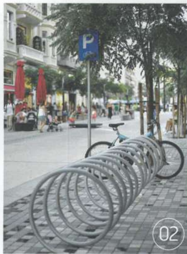
02 Εκατέρωθεν της κεντρικής περιοχής του ποδηλατόδρομου και του δρόμου για τους πεζούς υπάρχει ζώνη πλάτους 2,10 μέτρων. Σ' αυτή έχουν τοποθετηθεί ειδικά stands για την τοποθέτηση των ποδηλάτων.